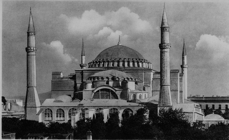
ISTANBUL. Ayasofya — Mosquée St. Sophie