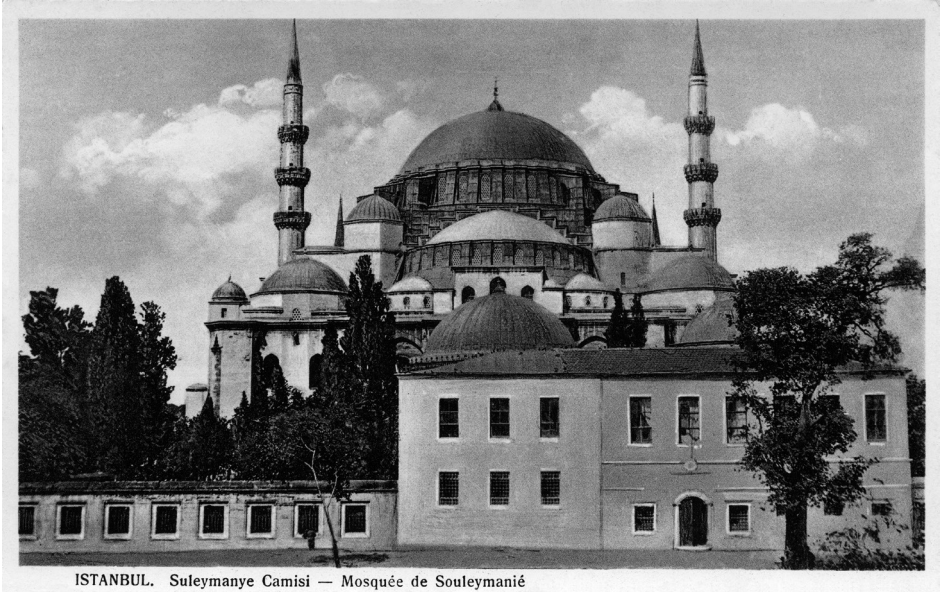
ISTANBUL. Süleymaniye Camisi — Mosquée de Souleymanié