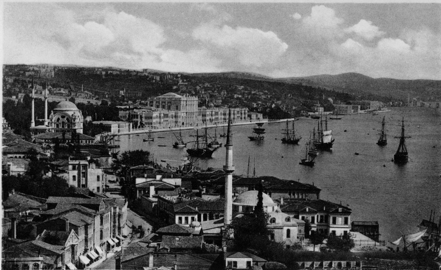
ISTANBUL. Dolma Bahçe sarayı — Palais de Dolma-Bagtsché