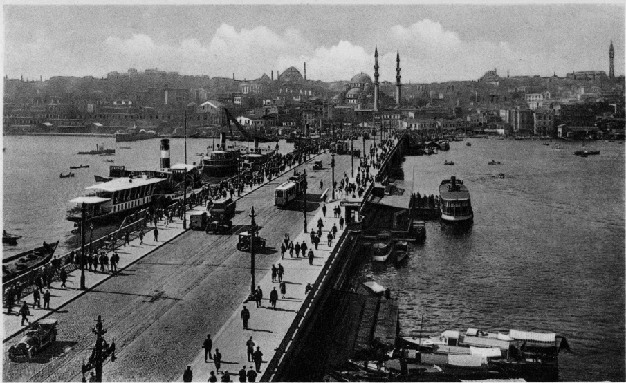
ISTANBUL. Galata köprüsü — Le pont de Galata