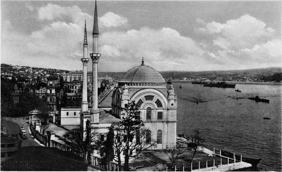
ISTANBUL. Dolma Bahçe Camisi — Mosquée de Dolma-Bagtsché