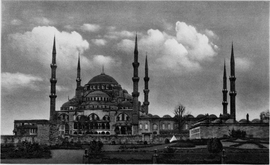
ISTANBUL. Sultan Ahmet Camisi — Mosquée de Sultan Ahmet